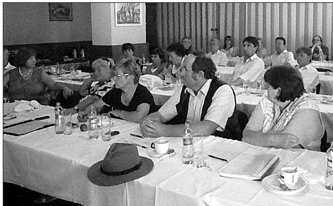
Úvodní workshopy ve Fryšavě pod Žakovou horou

Již v květnu 2008 vyjádřily statutární zástupkyně OS TOK souhlas s partnerstvím ATOK ve společném projektu, který by se věnoval výhradně bipartitnímu sociálnímu dialogu. Tak by mohly být řešeny otázky v odvětví na rozdíl od již déle běžícího projektu Posilování sociálního dialogu – služby pro zaměstnance, kde je gestorem projektu MPSV ČR, předkladatelem Českomoravská konfederace odborových svazů a partnerem Asociace samostatných odborů. Tento projekt se věnuje problematice zaměstnanců obecně.