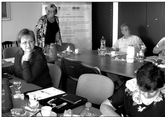
Záběr z workshopu v Praze