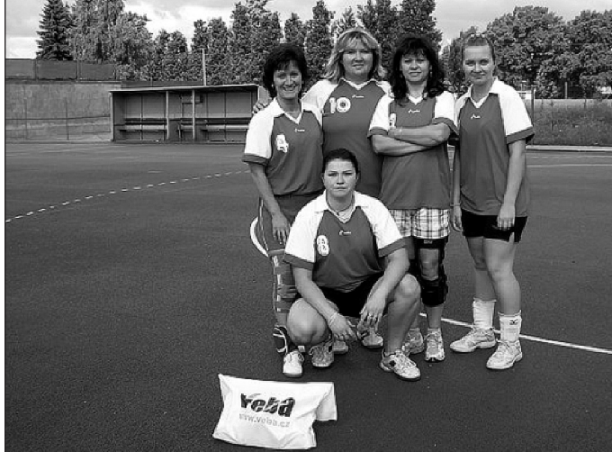
Vítězky soutěže ve volejbalu – družstvo z Veby Broumov