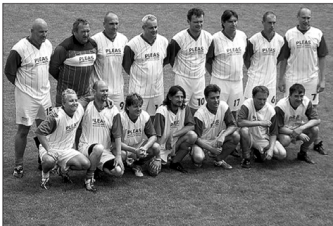
Vítězné mužstvo v kopané z Pleasu Havlíčkův Brod

Při této příležitosti jsem si uvědomil, že tato sportovní soutěžní setkání přináší vzájemná poznání jednotlivých odborových organizací a v některých případech i pevná přátelství mezi sportovci a ostatními účastníky. Považuji tuto skutečnost za velmi užitečnou nejen v rámci budování mezilidských vztahů, ale také pro součinnost v ostatní práci OS TOK.