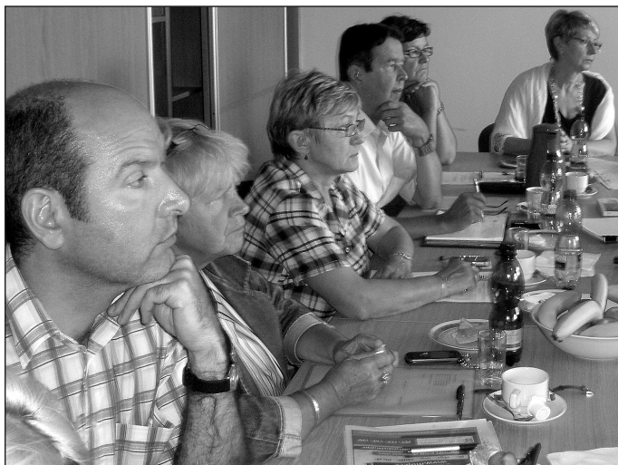
Workshop v Praze

V následujícím roce byl původní záměr ATOK a OS TOK rozšířen o další platformy (zaměstnavatelské a odborové partnery), jako jsou stavbaři, horníci, obchod, zdravotníci a další, zaštitované na straně odborů ČMKOS a na straně zaměstnavatelů pak Konfederací zaměstnavatelských a podnikatelských svazů.